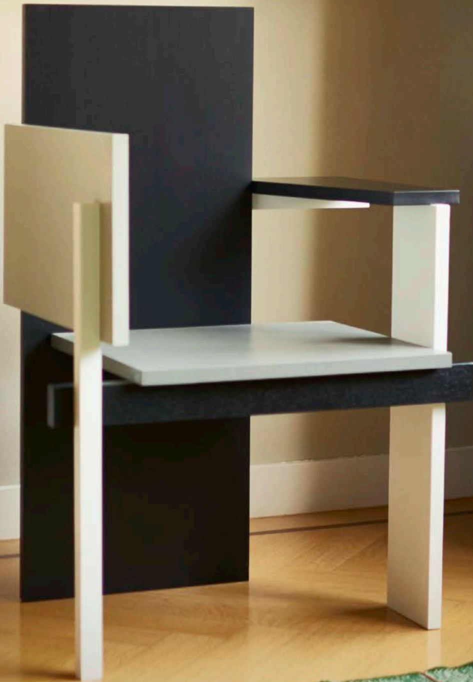
Berlijnse stoel Gerrit Rietveld - Rietveld Originals - 1923