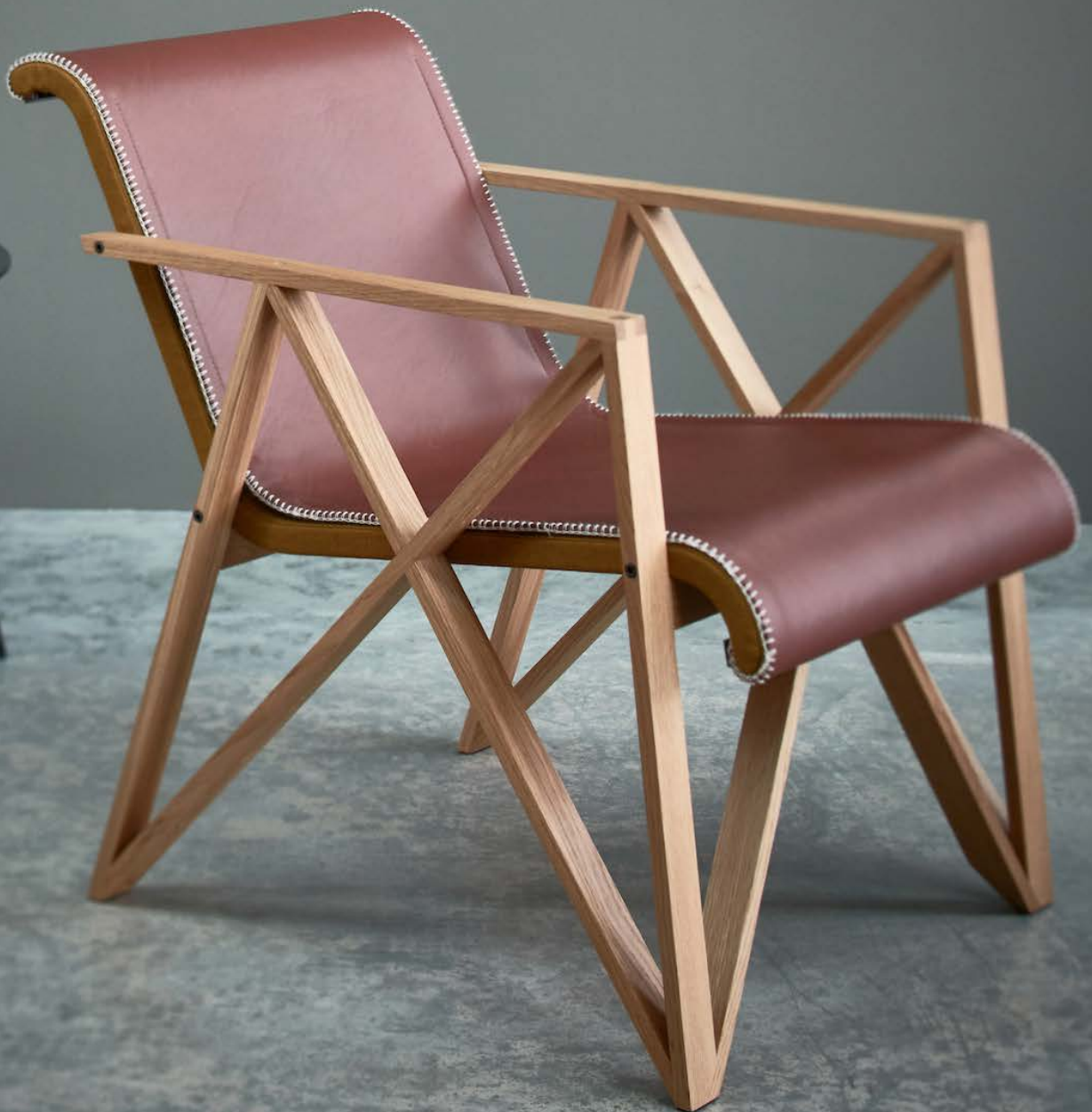
Fauteuil voor Metz&Co Gerrit Rietveld - Rietveld Originals - 1942