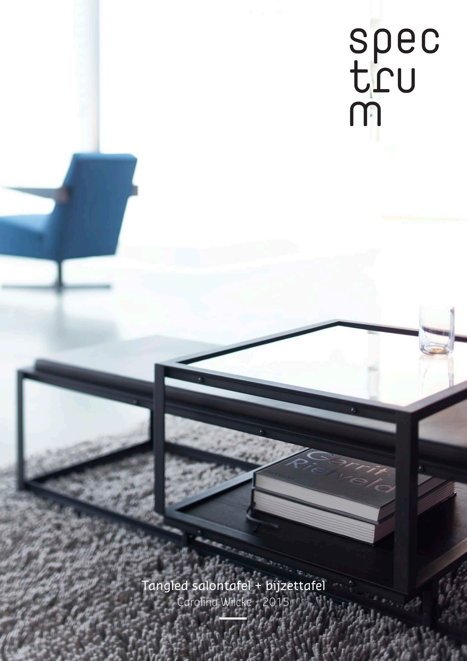
Tangled salontafel + bijzettafel Carolina Wilcke - 2015