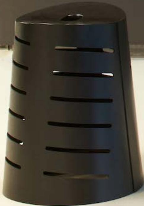
TC kruk Ruud-Jan Kokke - 1989