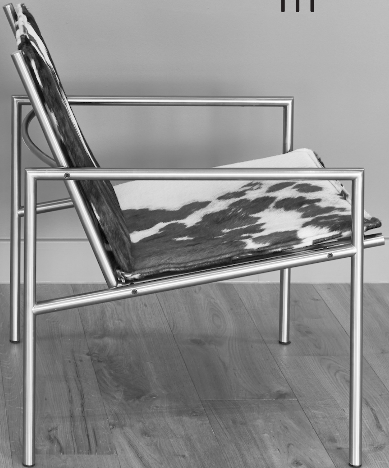
SZ 01 pitriet fauteuil & SZ 03 gestoffeerde fauteuil Martin Visser - 1960