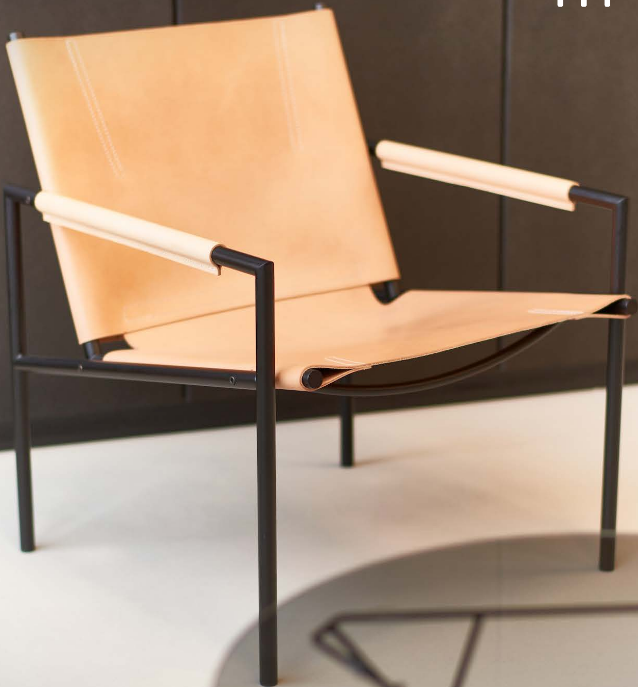
SZ 02 fauteuil met tuigleer Martin Visser - 1960