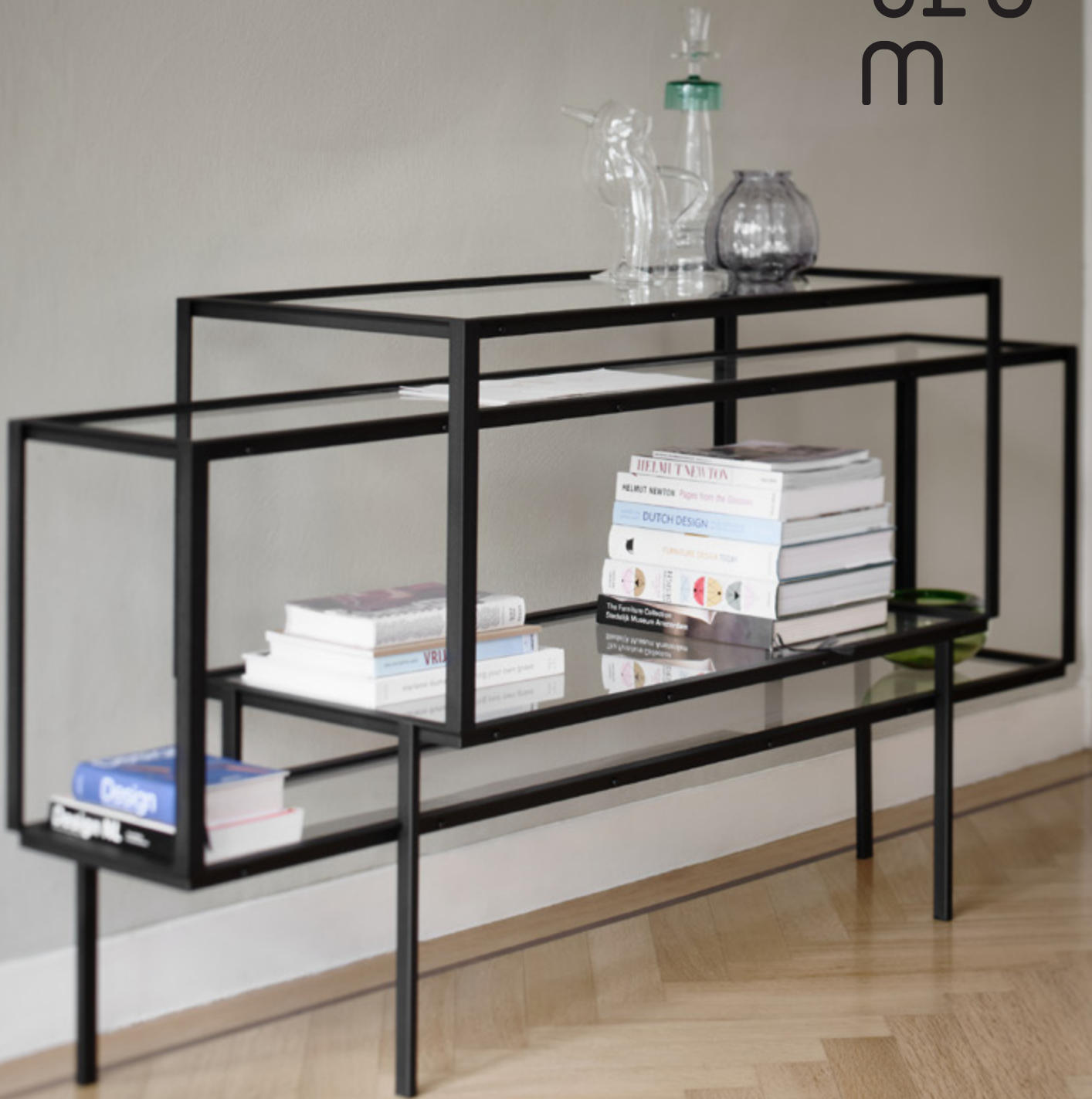
Tangled Kabinettschrank Carolina Wilcke - 2015